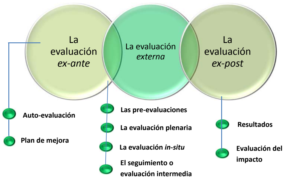
Figura (2.2) Etapas del proceso de evaluación del PNPC